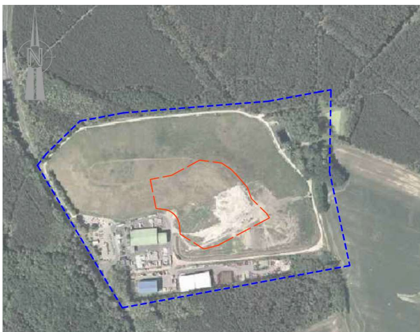
Übersicht Deponie- standort und Erweiterungs- bereich (rot)

Die Siedlungsabfalldeponie „Alte Ziegelei“ wurde vor 1990 errichtet und betrieben. Innerhalb der Anlagengrenze ist ein Teilbereich in der Historie nicht für die Ablagerung von Abfällen vorgesehen worden. Im Interesse der übergeordneten Gewährleistung der Entsorgungssicherheit im Landkreis wurde das am Standort vorhandene Potential zur Erweiterung der Deponie durch Herstellung einer Basis- bzw. Zwischenabdichtung auf einer Fläche von ca. 16.000 m 2 genutzt.